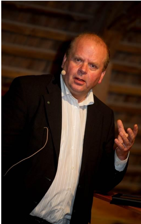
Landsbygdsminister Eskil Erlandsson