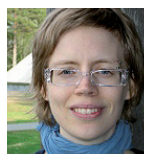
Malin Lindberg Winnet Centre of Excellence