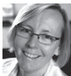
Inger Danilda Encounter AB